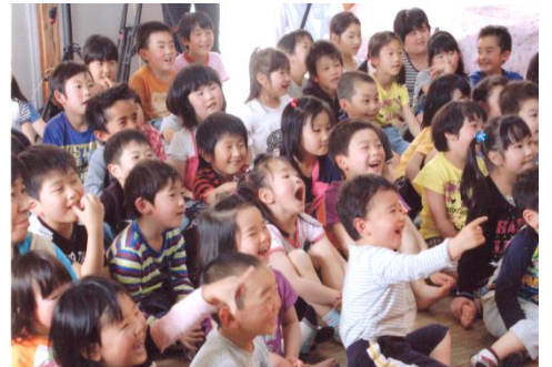
入谷東幼稚園の子どもたちの笑顔