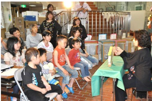
東松島市小野市民センターの避難所。 子どもたちが「大きなかぶ」を楽しむ。