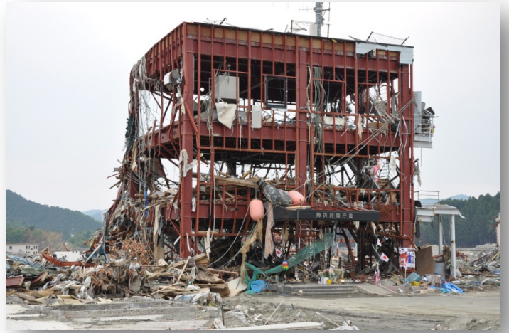
南三陸町、防災対策庁舎

南三陸町、東松島市、松島町、七ヶ浜町、利府町にて6回のボランティア公演をしてきました。津波によって甚大な被害を受け、避難生活を余儀なくされている人達に寄り添おうと出かけました。被災地の子供たちを喜ばせようと思い・・・。