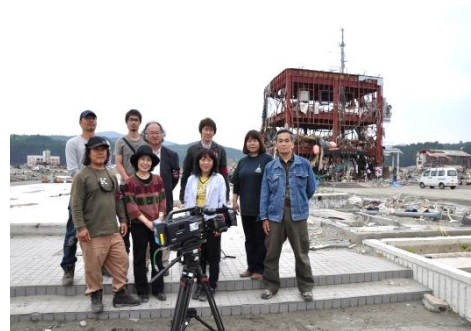
NHK エンタープライズの方々と。