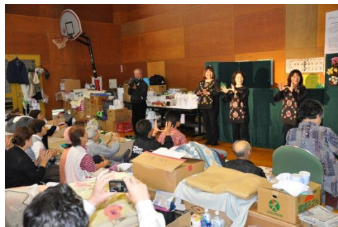
松島町の農村改善センター。避難所での生活も2か月が過ぎた…。 東松島市の方々が、人形劇・歌に涙を流して喜んでくださった。