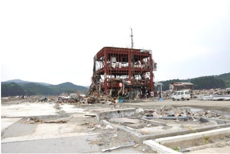
南三陸町は中心市街がかつての志津川町。「青年アンサンブル」「希望」「遥かなる島」を上演している。